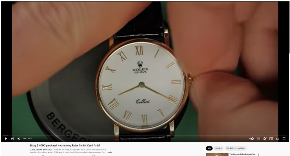
Abbildung 3 - Video aus der Videosektion